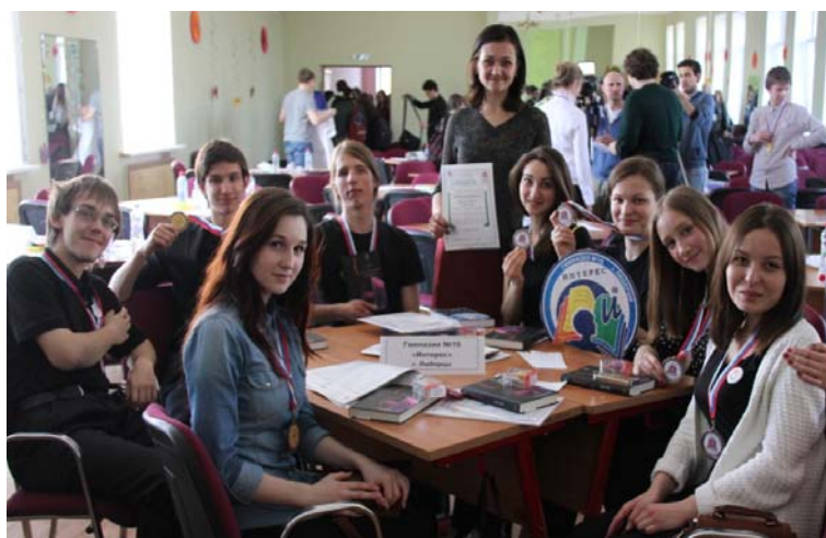
Победа в 6 Турнире знатоков естественных наук 2014 г.

7. Учащиеся медико-биологических классов становятся активными участниками, победителями и призёрами предметных олимпиад по биологии, химии и др., в том числе муниципального и регионального этапов Всероссийской олимпиады школьников, олимпиады и турнира «Ломоносов», Московского государственного университета им. М.В. Ломоносова, тем самым получая дополнительные преимущества при поступлении в ВУЗы.